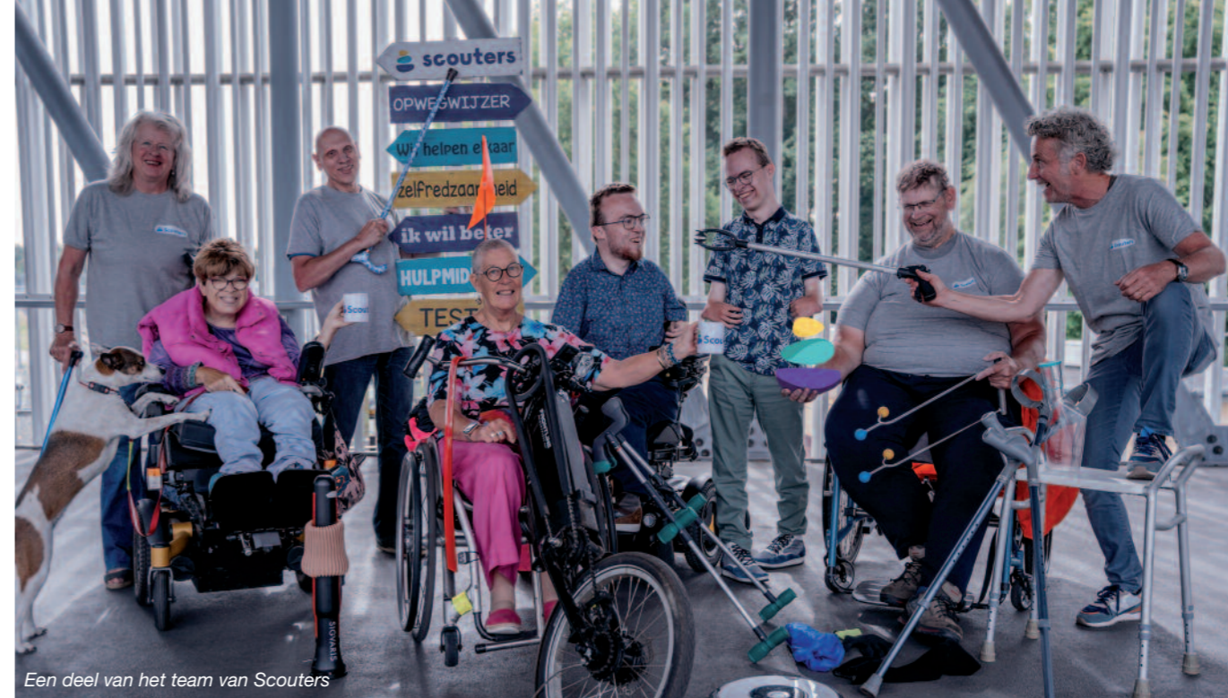
Een deel van het team van Scouters

rol bij spelen. Want ga er maar aan staan: naast de emotionele en mentale uitdagingen moet je na de revalidatie ook leren omgaan met je nieuwe (on)mogelijkheden in het dagelijks leven. Allerlei activiteiten die voorheen zo vanzelfsprekend leken - zoals huishouden, werk en hobby's - zul je opnieuw moeten invullen. De ZelfredzaamheidsRadar kan daarbij helpen.